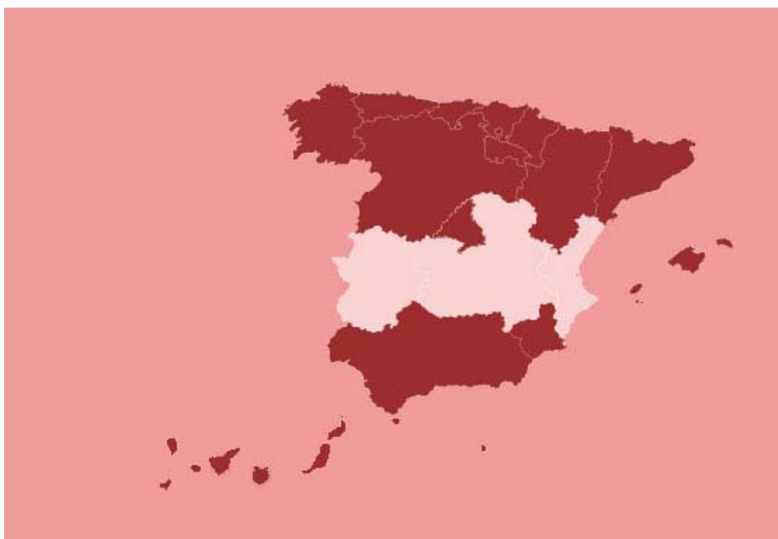
Mapa 2: España y las Comunidades Autónomas en PISA 2009

España ha participado en este estudio desde su primera edición del 2000. En el 2009 catorce Comunidades Autónomas, más las ciudades autónomas de Ceuta y Melilla, (ver mapa 2) han ampliado la muestra de alumnos para obtener datos regionales.